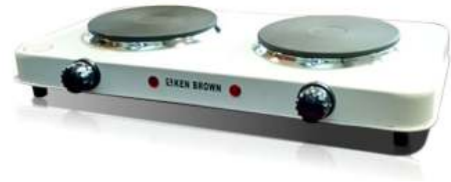
IMAGEN A MODO ILUSTRATIVO

Antes de usar la unidad, lo invitamos a que lea atentamente el Manual con el fin de familiarizarse con éste artefacto, para optimizar su funcionamiento y evitar daños o accidentes.