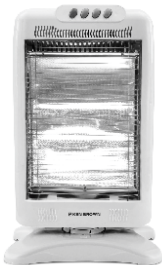
IMAGEN A MODO ILUSTRATIVO

Características Nominales: 220V~ 50Hz 400/800/1200W CLASE I